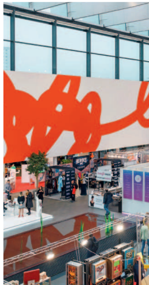
Alcune immagini dell'edizione 2023 di Spielwarenmesse